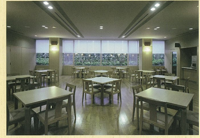
軽食・喫茶コーナー